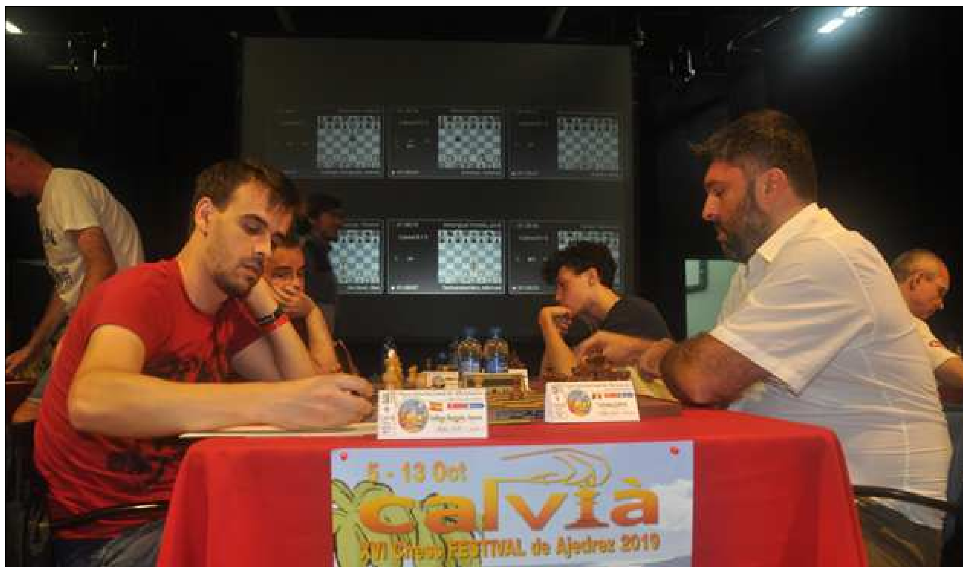
Gallego vs Voiteanu

22.♖b3 ♔a4 23.♖a1 ♔c4 24.♖xa6 ♖b4 25.♖a4 ♔c6 26.♖a1 ♖fc8 27.♘d4 ♙xd4 28.♖xd4 ♗xc3 29.♗xc3 ♗g6 ½-½