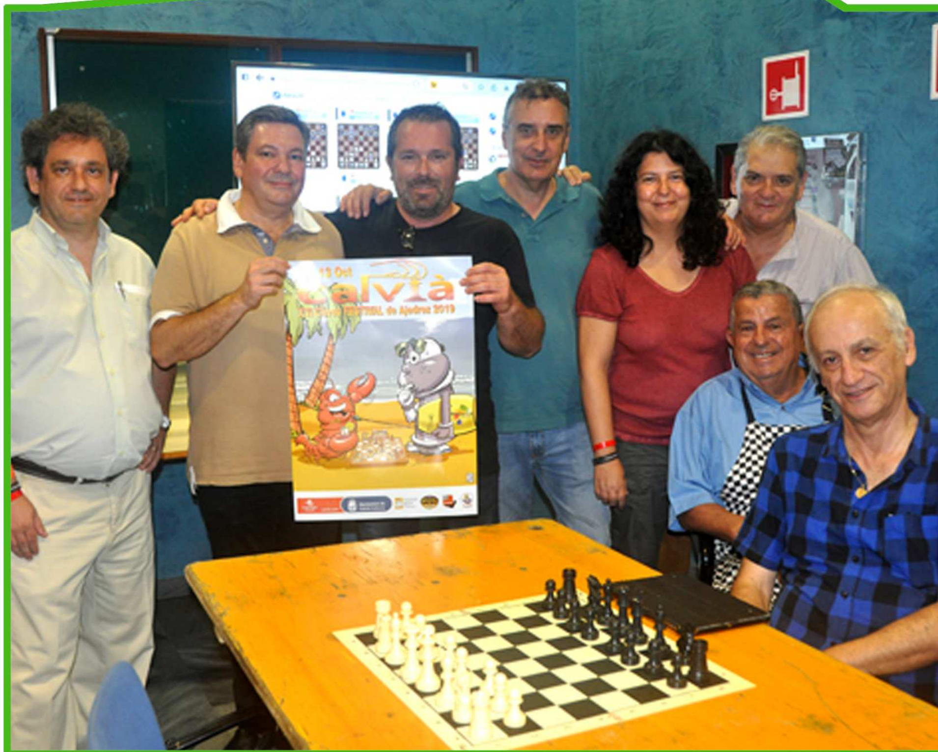
Equipo organizador del Festival de Calvià